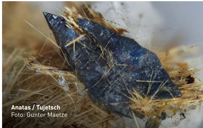
Anatas / Tujetsch

Aus den Aachener Sanden (Santon – Oberkreide) werden Pflanzenfossilien, z. B. versteinerte Hölzer und Blätter, vorgestellt. Sie wurden in sandigen und schluffigen Ablagerungen in der deutsch/belgischen Region südlich von Aachen, in der Nähe von Kelmis (La Calamine) und Hauset, gefunden.