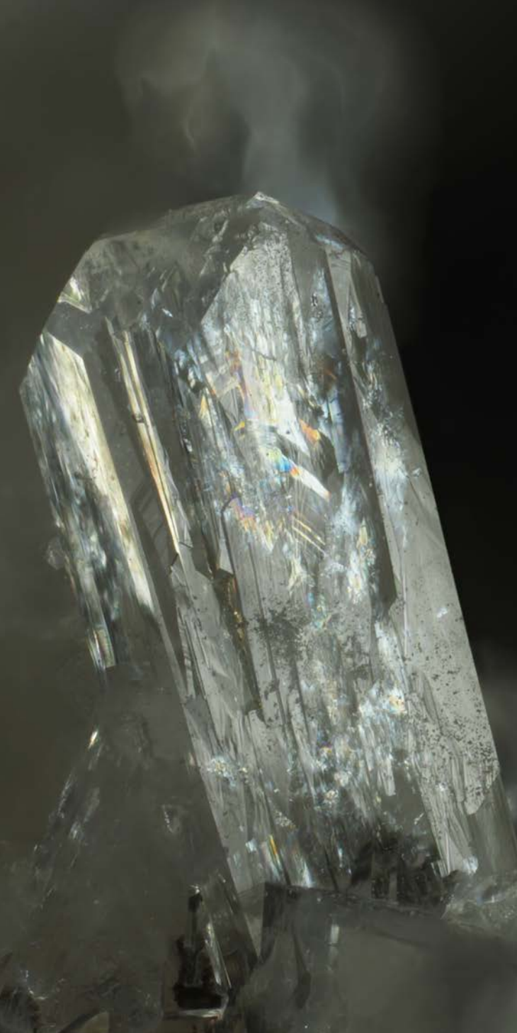
Stilbit, Rumänien

PIZZERIA LA RUSTICA Rappenhofweg 10 74189 Weinsberg