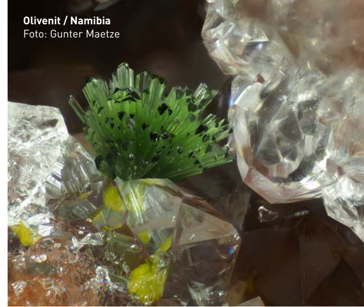
Olivenit / Namibia